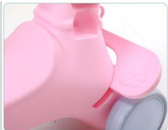
2. Zamocuj podnóżek