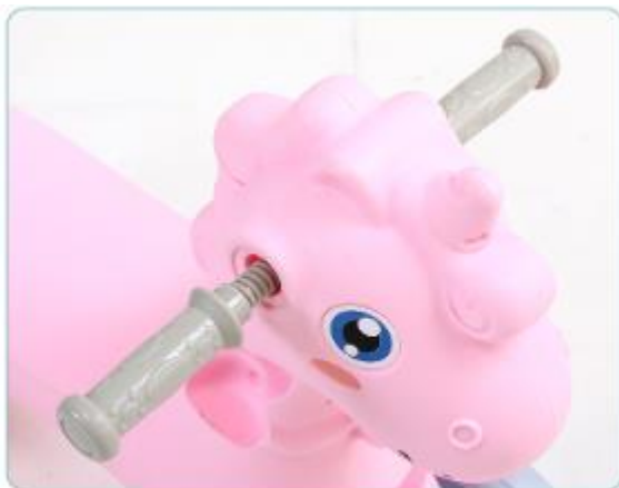
1. Zamocuj uchwyty