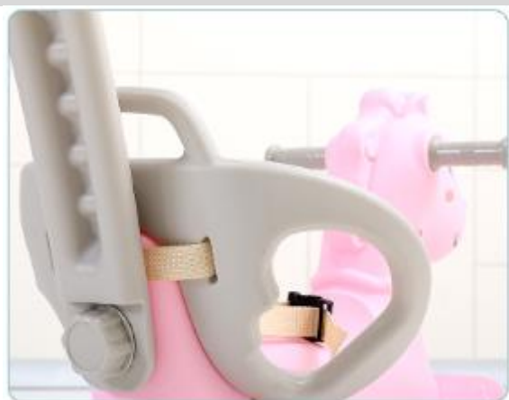
5. Przymocuj uchwyt do oparcia