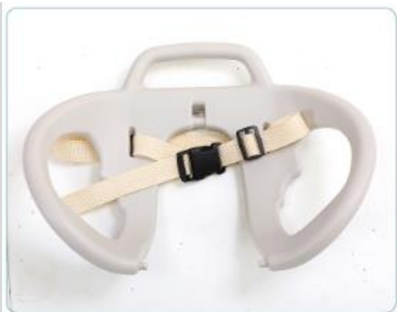
3. Przymocuj pasy do oparcia