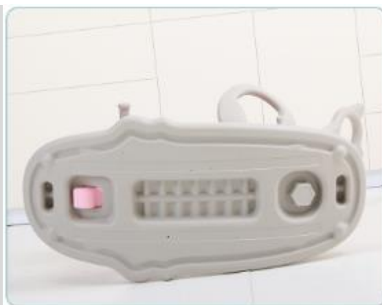
6. Wkręcić śruby od spodu.