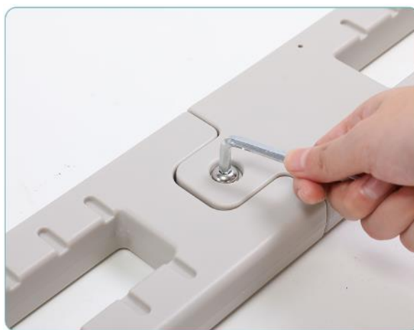
2. Połączyć obie części za pomocą klucza imbusowego