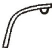
D – Górna część ramy