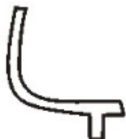
C – Dolna część ramy